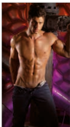
maggio - giugno