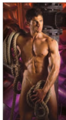
settembre - ottobre