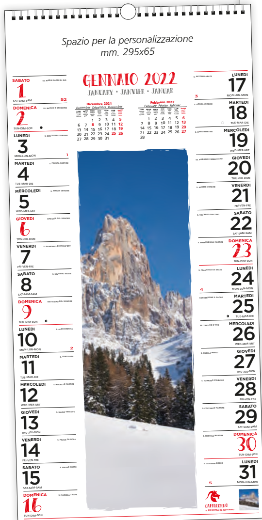
F.to mm. 325x680