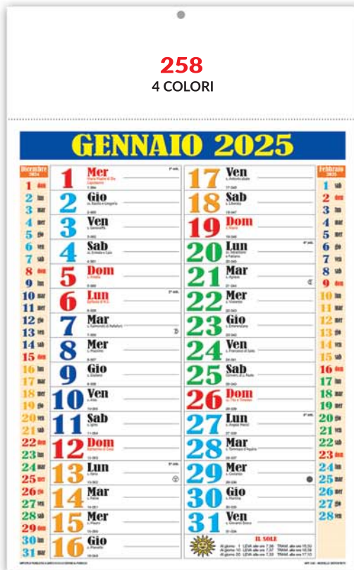
12 fogli - Termosaldato Formato cm. 29x47