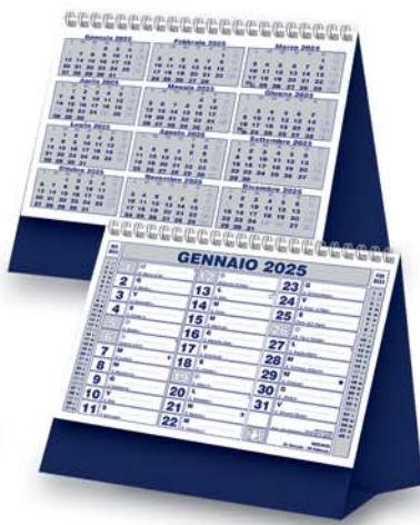
12 fogli - Spiralato Formato cm. 19,5x14,5