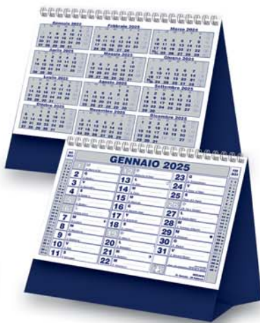
12 fogli - Spiralato Formato cm. 19,5x14,5