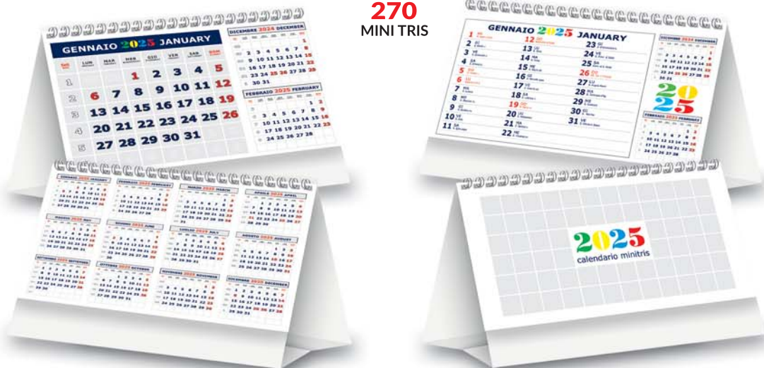
13 fogli - Spiralato Formato cm. 19x14,5