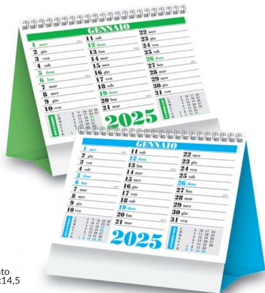
12 fogli - Spiralato Formato cm. 16,5x14,5