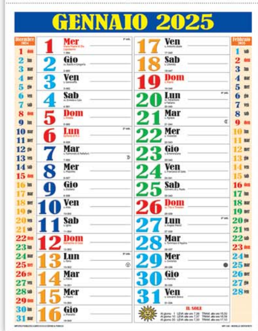
12 fogli - Termosaldato Formato cm. 29x47